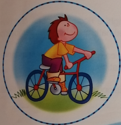
1 a causa