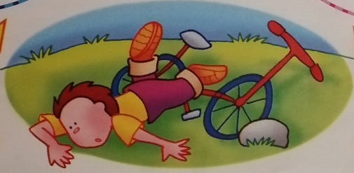
1 a conseguenza